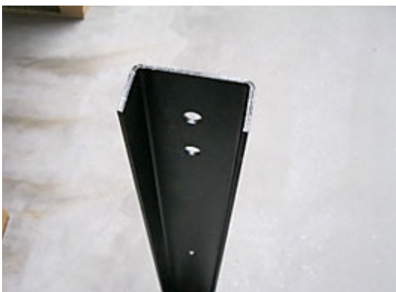
Reparatur eines Regalständers mittels einer Ständeraufschuhung.

Im Rahmen der statischen Möglichkeiten setzen wir defekte Regalständer unter Zuhilfenahme von Konstruktionsprofilen als Ständeraufschuhung, nach vorheriger Richtung der beschädigten Regalständer instand. Selbstverständlich liefern wir Ihnen hierfür die entsprechende Statik.